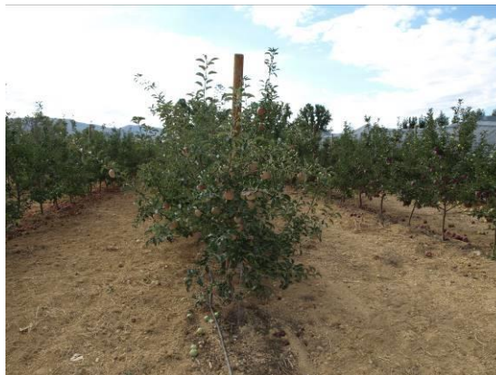
Cultivo del manzano en finca Las Nogueras (2016).

La mayoría de las variedades cultivadas en España corresponden al tipo Golden, seguidas de las del grupo Gala, Red Delicious y de otros como Fuji, Reinetas y Granny Smith. La tendencia en Golden es implantar las más productivas, con buenas características organolépticas y con menos sensibilidad a russetin, en el resto de grupos las nuevas variedades también buscan tener una mejor coloración de la epidermis.