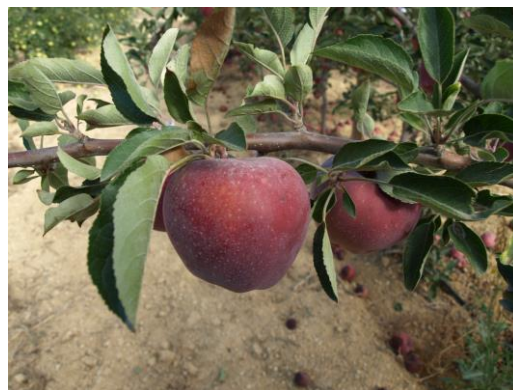
Producción de manzana.

El manzano es un frutal de pepita de la familia de las Rosaceae, genero Malus, la mayoría de las variedades cultivadas corresponde a " Malus x domestica Burkh". Es un árbol caducifolio cuyo fruto es un pomo de color variable y forma esférica. Especie de clima templado, requiere frío invernal, poco sensible a calores estivales elevados, exigente en agua, no muy exigente en suelo y de raíces superficiales. En muchos casos autoestéril, necesita la ayuda de otra variedad polinizadora y del concurso de las abejas.