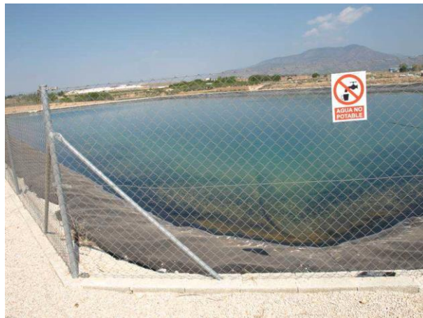
Embalse de riego CDA Las Nogueras de Arriba.