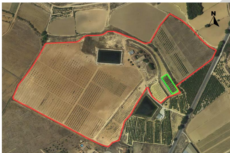
Ubicación de los manzanos en el CDA Las Nogueras de Arriba.

El proyecto tiene una superficie de 0,25 has y se encuentra situado en una pequeña parcela con coordenadas UTM-Huso 30 (ETRS-89); 596.044/4.210.808 ubicada en el CDA Las Nogueras de Arriba, propiedad de la Comunidad Autónoma de la Región de Murcia, catastralmente en las parcelas 385 del polígono 129 en el paraje Los Prados, T.M de Caravaca de la Cruz.