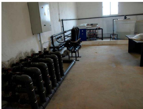
Cabezal de riego de Las Nogueras de Arriba.

Uso de programas de riego para evitar un consumo innecesario del agua. Este programa de riego tiene en cuenta parámetros como el clima y los datos del cultivo.