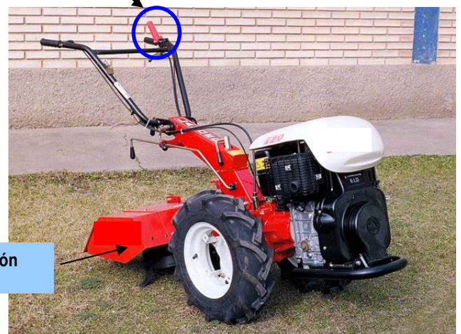
Palanca supletoria marcha atrás