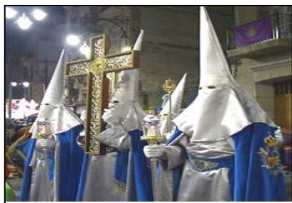
Semana Santa en Cartagena

Los recursos culturales están vinculados al patrimonio tangible e intangible, relativo a gastronomía, tradiciones, fiestas y manifestaciones culturales, museos y colecciones artísticas y culturales de relevancia, artesanía y eventos especiales.