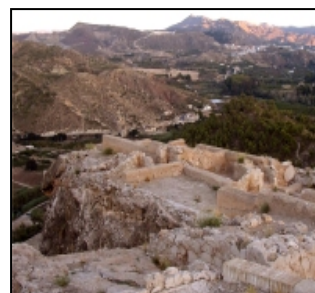
Yacimiento arqueológico de Medina Siyasa

teniendo algunos valores significativos no llegan a la relevancia reconocida de los B.I.C.