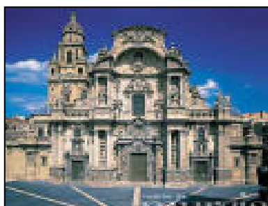
Catedral de Murcia

Los recursos históricos-artísticos o monumental son los referidos básicamente al patrimonio tangible o edificado, que se manifiesta en monumentos (iglesias, castillos, centros históricos, etc.), yacimientos arqueológicos, pinturas rupestres, etc.