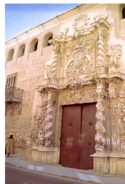
Casa de las Columnas