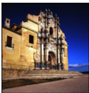
Santuario de la Vera Cruz